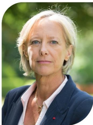
Sophie Cluzel Secrétaire d'État chargée des Personnes handicapées