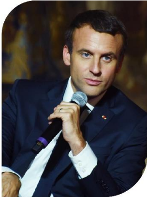
Emmanuel Macron Président de la République

Allez dans une classe avec un élève en situation de handicap. Au début de l'année, il y en a toujours pour se moquer. Que révèlent réellement ces railleries ? Elles sont le cri de faiblesse du groupe. Les enfants qui se moquent pensent déstabiliser celle ou celui qui ne leur ressemble pas, mais en réalité, c'est leur propre malaise qu'ils expriment face à ce qu'ils ne connaissent pas, leurs propres failles qu'ils mettent à jour. Ce peut être un mélange de peur, d'embarras, le sentiment de ne pas savoir comment parler de cette différence, comment agir face à l'autre.