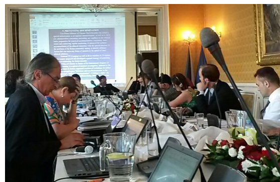
Réunion de CAHROM à Prague

roms en général. Plusieurs pays notamment l'Espagne, l'Italie et la Grande Bretagne ont donné un écho favorable sur l'importance de la vision transnationale concernant ce sujet. La prochaine réunion du Cahrom se tiendra à Strasbourg du 24 au 27 octobre.